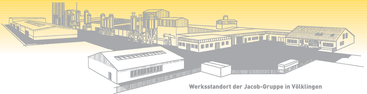
Werksstandort der Jacob-Gruppe in Völklingen

Die Mitarbeiter der Bernhard Jacob Lux S.A. verfügen über langjährige Erfahrungen in Entwicklung, Produktion, Vertrieb sowie im Einbau von Feuerfest-Produkten im Hochofenbereich.